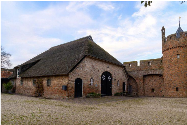
Deel van de voorburch van kasteel Doornenburg

Op de eerste verdieping van het robuuste Kasteel Doornenburg is een tijdelijke tentoonstelling ingericht: Bouw, de bouw van een middeleeuws kasteel . En er wordt in Doornenburg nog steeds aan het kasteel gebouwd. De tentoonstelling is te bekijken in het weekend tussen 11.00 en 16.00 uur. Zie: De bouw van een middeleeuws kasteel... - Omroep Lingewaard