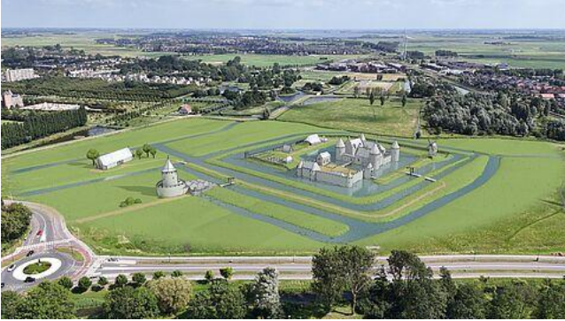
Kasteel Oud Haerlem door Marius Bruijn

Op 20 juni a.s. vindt in Zutphen het symposium 'Oorlog en Vrede in de Middeleeuwen ~ Realiteit, Herinnering en Mythe' plaats. Zie voor het programma: Programma symposium 20 juni | Oorlog en Vrede in de Middeleeuwen . De dag ervoor is er ook een Collegetour. De Collegetour biedt verdiepende lezingen en excursies.